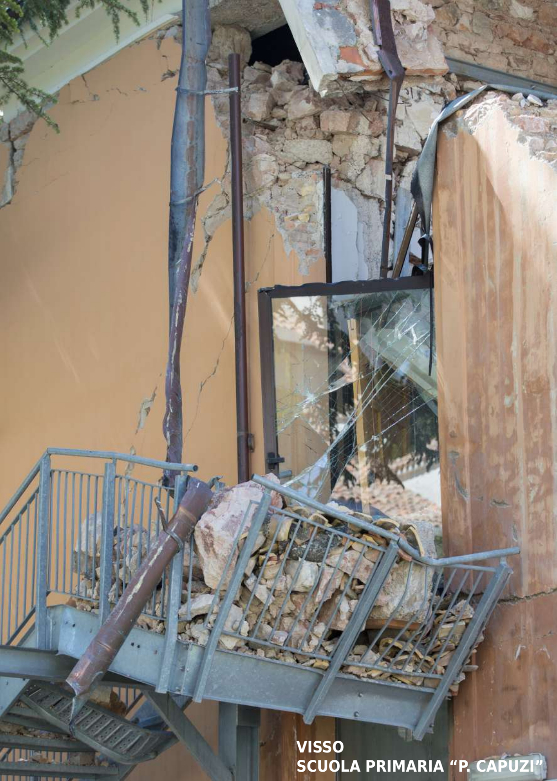
VISSO SCUOLA PRIMARIA "P. CAPUZI"